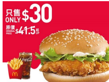
$30 脆辣雞腿飽超值套餐超值套餐