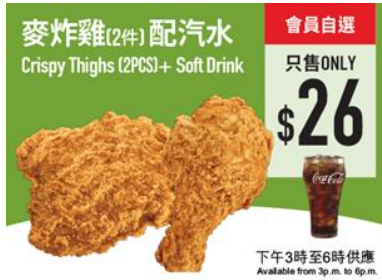
【下午茶優惠】$26 歎 2 件原味麥炸雞配汽水 (或+$2 轉配蜜糖 BBQ/ 鹽酥麥炸雞)