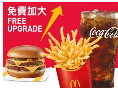
選購超值套餐免費升級加大超值套餐 [可重複使用]