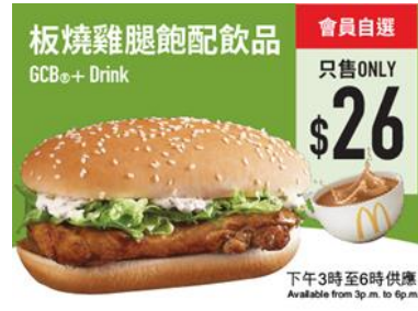
【下午茶優惠】$26 板燒雞腿飽配飲品