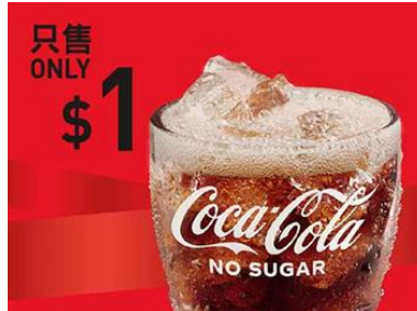
$1 大款可樂 (星期一至五適用)