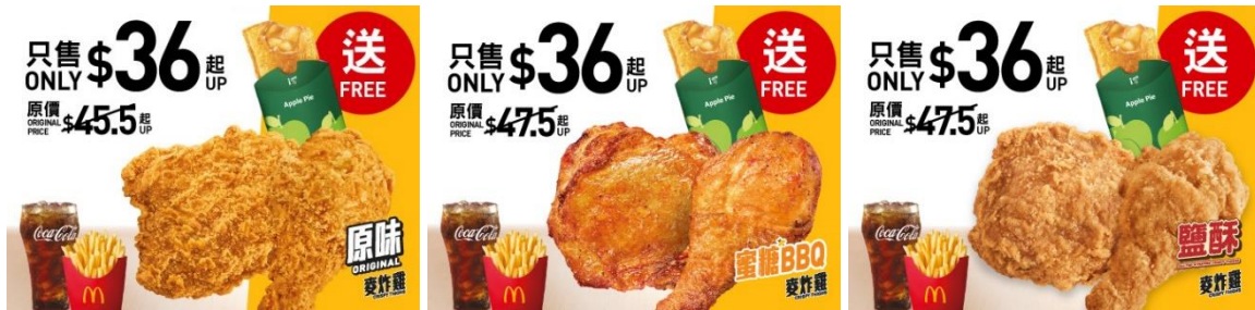
$36 麥炸雞(2件)超值套餐及免費送蘋果批 / 菠蘿吉士批