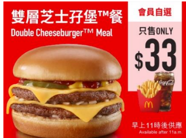
$33 雙層芝士孖堡超值套餐